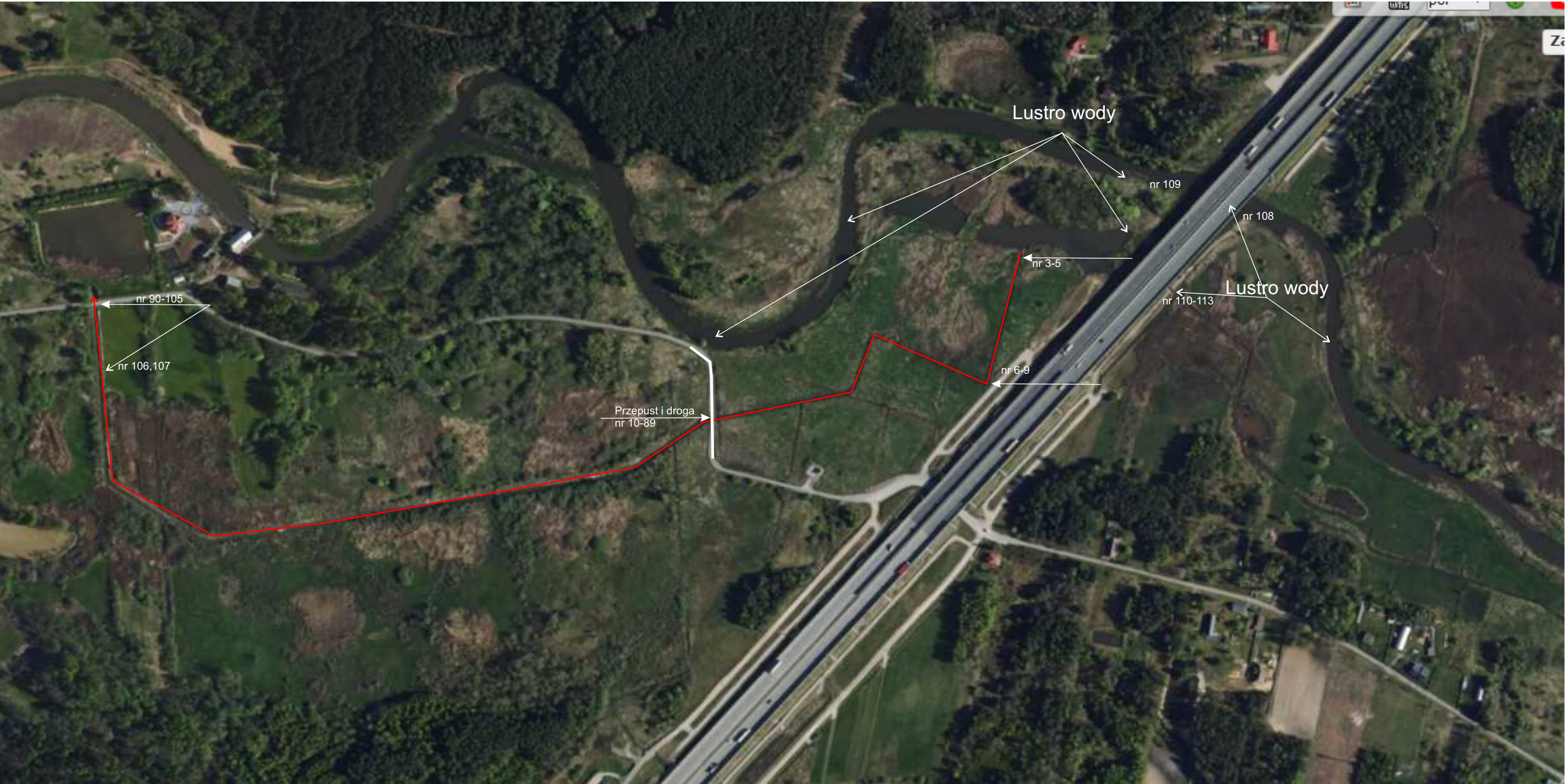
Schemat rozmieszczenia pomiarów